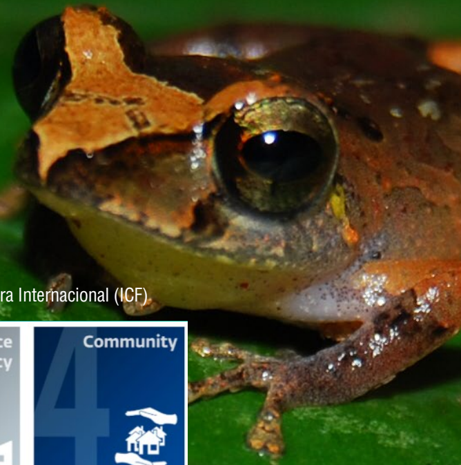
Figura 2: Normas de desempeño de la Corporación Financiera Internacional (ICF)

EL GCF adoptó como Salvaguardas Ambientales y Sociales (ESS) provisionales, las normas de desempeño de la Corporación Financiera Internacional (ICF, por sus siglas en inglés), perteneciente al Grupo de Banco Mundial (GCF, 2019). Estas salvaguardas son usadas como parte del marco de acreditación de las Entidades Acreditadas (AE) y deben estar incorporadas en sus respectivos sistemas de gestión ambiental y social. Son ocho las normas de desempeño de la IFC tal como se muestran en la Figura 2 (IFC, 2012):