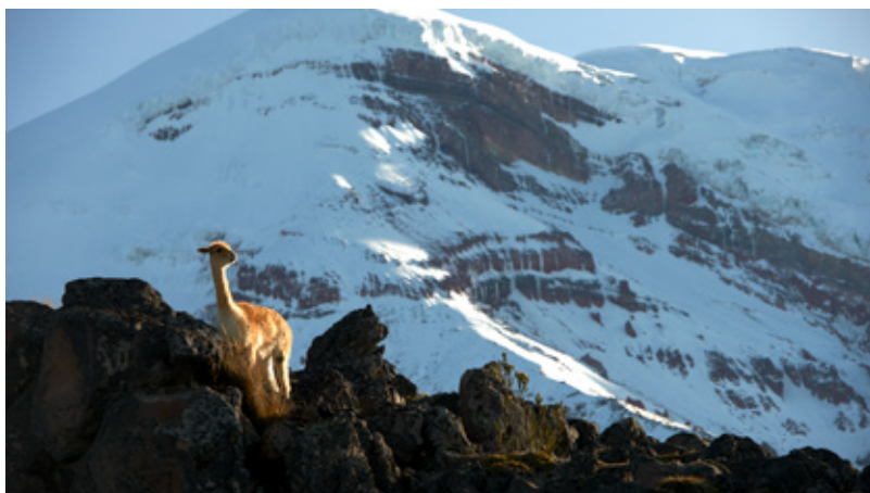
Tabla de contenidos

2. Departamento de Ecología y Gestión Ambiental, CURE (Centro Universitario Regional Este) – Facultad de Ciencias (Udelar).